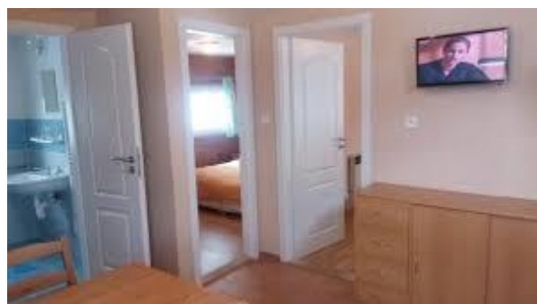
Hütte L ->